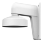
DS-1272ZJ-110 Настенный кронштейн