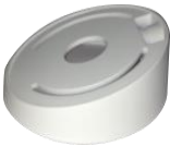
DS-1259ZJ Потолочное крепление