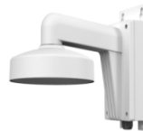
DS-1272ZJ-110B Настенный кронштейн